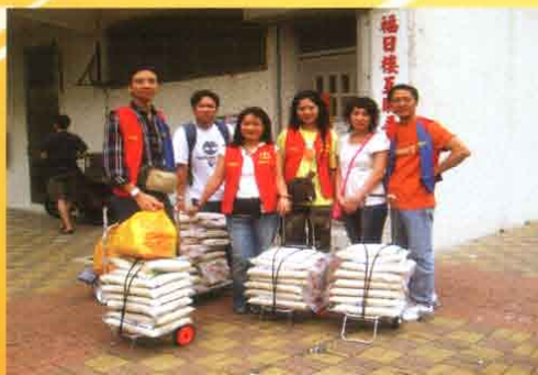
贈米圖(三)： 每一個月，師兄們都懷著師父對有情無緣大悲的愛心，將四十包白米贈與各區長者。