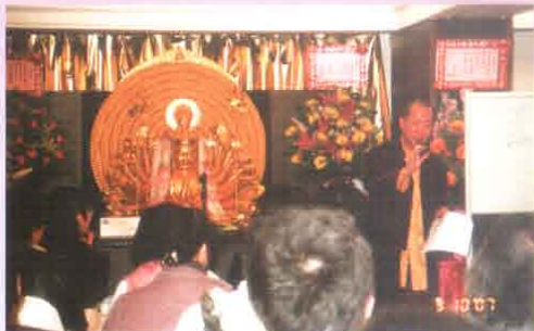
講堂開光圖(二)： 師父為【盛世大雄觀世音菩薩】開光，法力加持，為善信祈福開示。