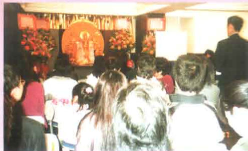
講堂開光圖(一)： 二零零七年三月十日觀音講堂正式啓用，善信聚首一堂。