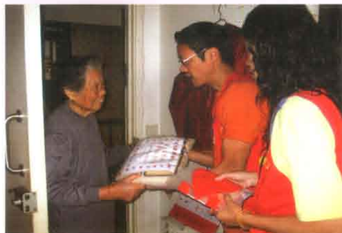
贈米圖(一)： 師兄將師父加持祈福的白米，親手傳遞到長者家中，長者完全不用日曬雨淋。