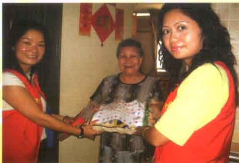
贈米圖(二)： 長者安享各界對他們的關愛慰問，師兄們更是樂此不疲。